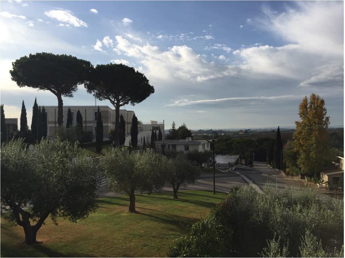
Vista de Fraterna Domus (Autor: Xiao Xiao)