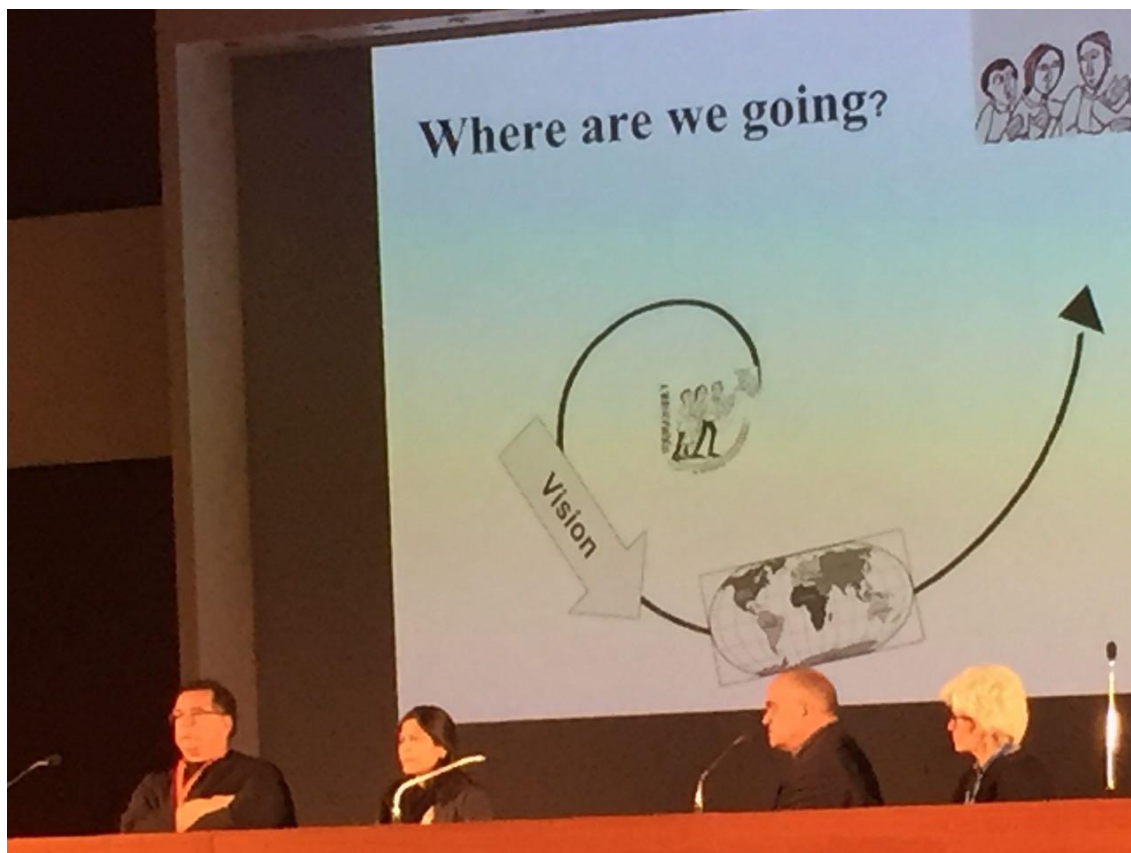
Definición de Declaración de la Visión para 2021.