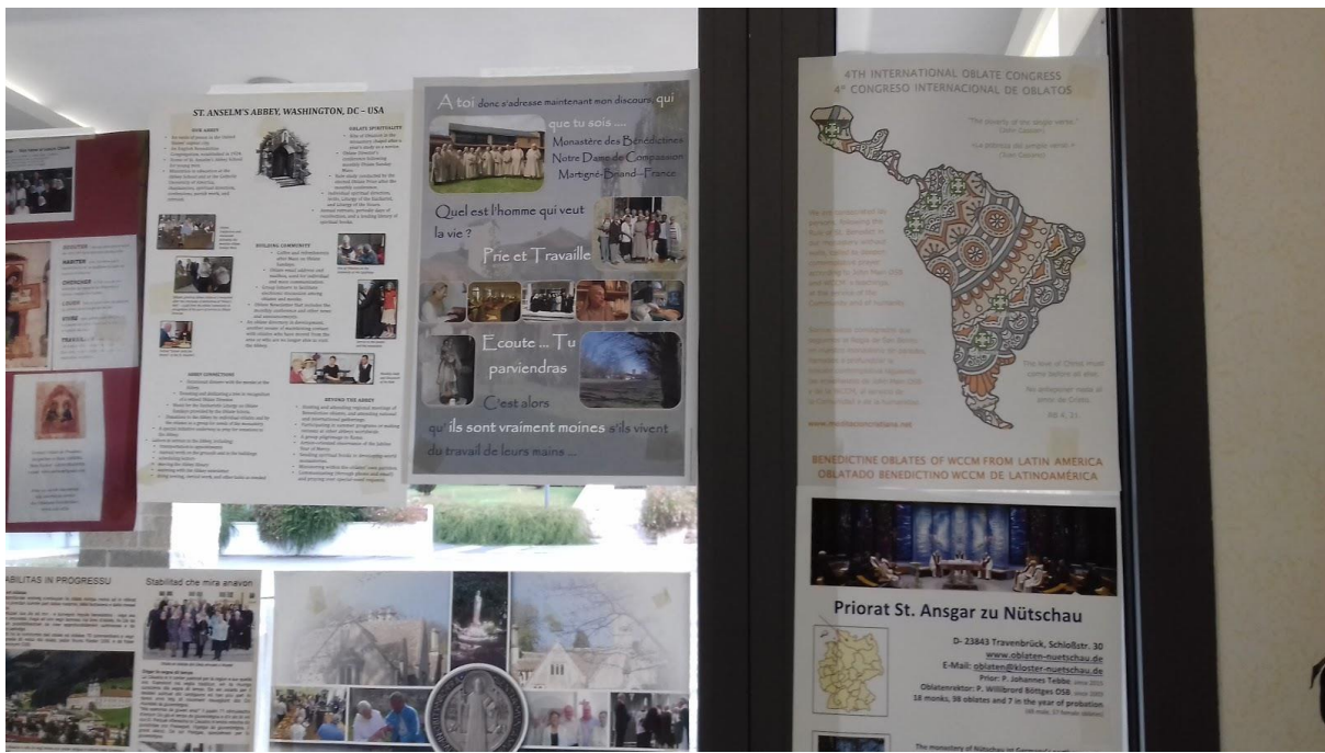
Carteles de WCCM: Oblatos Benedictinos de la WCCM en Hispano América