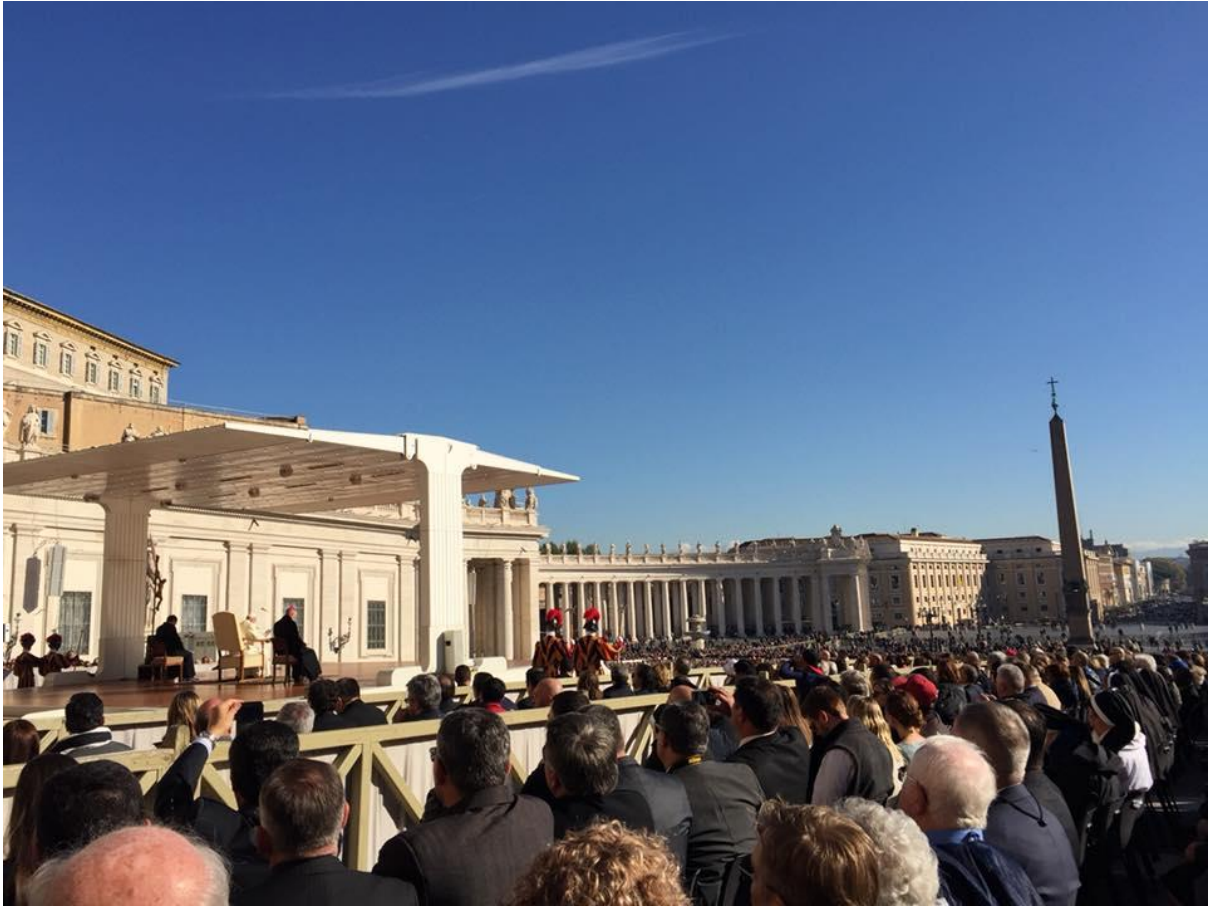
Visita al Vaticano: Audiencia General