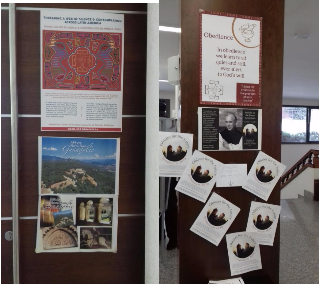
Carteles de WCCM: Meditación en Línea, Obediencia