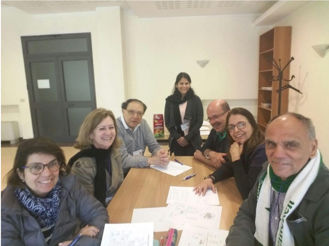
Taller para la definición de Declaración de la Visión 2021. Delegación de Brasil: Monasterios de San Mateo (Espiritu Santo) y San Benito (Rio de Janeiro)