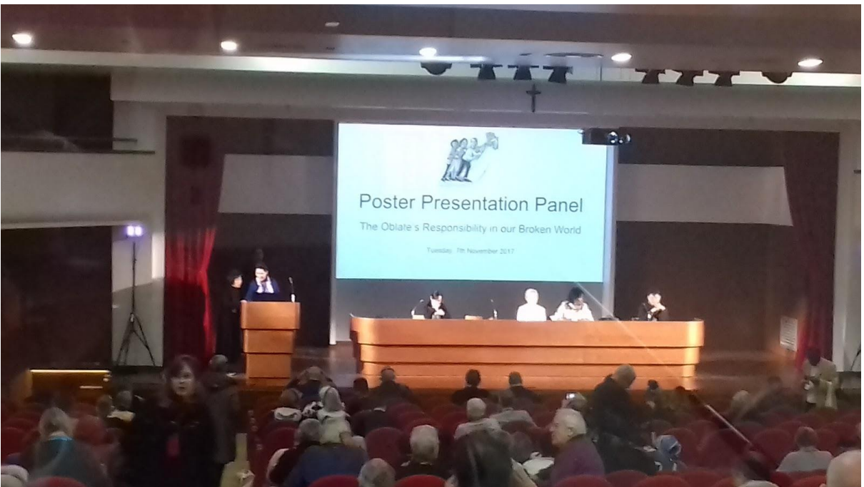
Presentación de Carteles en el auditorio