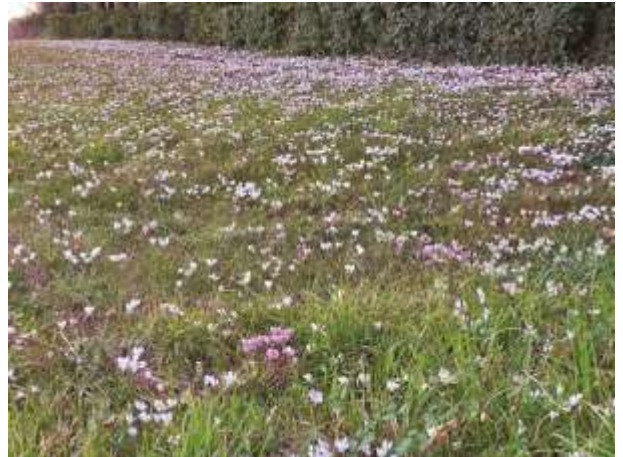
Los ciclamen en Bonnevaux

A los 8 años, yo dominaba el metro de Londres. A medida que crecí, siempre me sentí confiado explorando las junglas concretas de las nuevas ciudades que visité y me sentí como en casa en el rápido e impersonal flujo de la vida urbana. Los parques eran lugares grandiosos para jugar y hacer picnics, pero no podía poner nombres a la mayoría de las cosas que crecían allí, por encantadoras que fueran. Amaba las malvarrosas que crecían hasta tres metros, en sitios de construcción, senderos y jardines. Como niño, me parecían hermosas y excéntricas, con sus largos tallos y sus floraciones escarlatas, rosadas, blancas o de un morado oscuro. Me dijeron que eran bienales, pero yo no era lo suficientemente observador del mundo natural como para comprobarlo; había siempre tanto para hacer y descubrir en la ciudad. Pero en el jardín de nuestro hogar, llevé adelante un proyecto infantil megalomaniaco de resturar