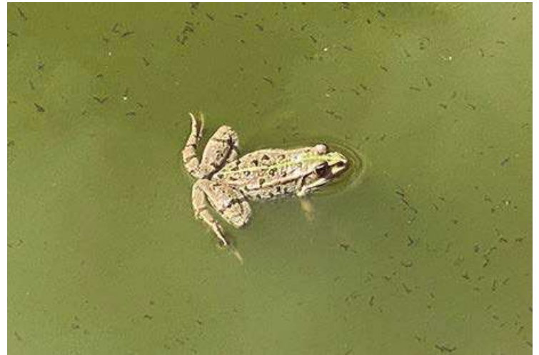
Rana en el lago de Bonnevaux

El mundo puede ser superado, pero no creando una realidad imaginaria "puramente espiritual", que es lo que intentan hacer las religiones separadas de su sabiduría contemplativa. La meditación nos despierta al reino mientras nos mantiene conectados a las duras irrealidades del mundo: las injusticias, la violencia y la ignorancia. Si el contemplativo no pudiera seguir comprometiéndose con estas cosas, su mediación sería en sí misma una ilusión.