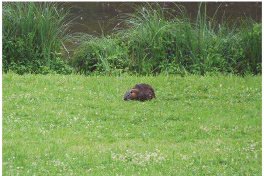
Los terrenos de Bonnevaux son un hogar para una rica diversidad de especies