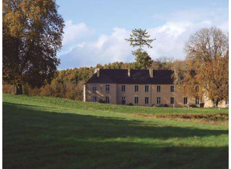
Abadía de Bonnevaux

En primer lugar, liberándonos del dominio del cientificismo materialista. La ciencia es esencialmente una práctica contemplativa. El materialismo es una variante moderna de la verdadera ciencia que provocó el divorcio entre la sabiduría de las tradiciones religiosas y la ciencia y rompió el vínculo entre ésta y las instituciones de la sociedad. Para enseñar una práctica espiritual hoy en día, por ejemplo en los negocios, la educación o la medicina, suele ser necesario justificarla mediante una prueba reduccionista de sus beneficios sociales y a nivel de salud. El significado completo -la conexión de enlace- entre la meditación y el conjunto de la vida humana se ignora oficialmente aunque, por supuesto, se manifiesta en la experiencia personal de quienes aprenden a meditar.