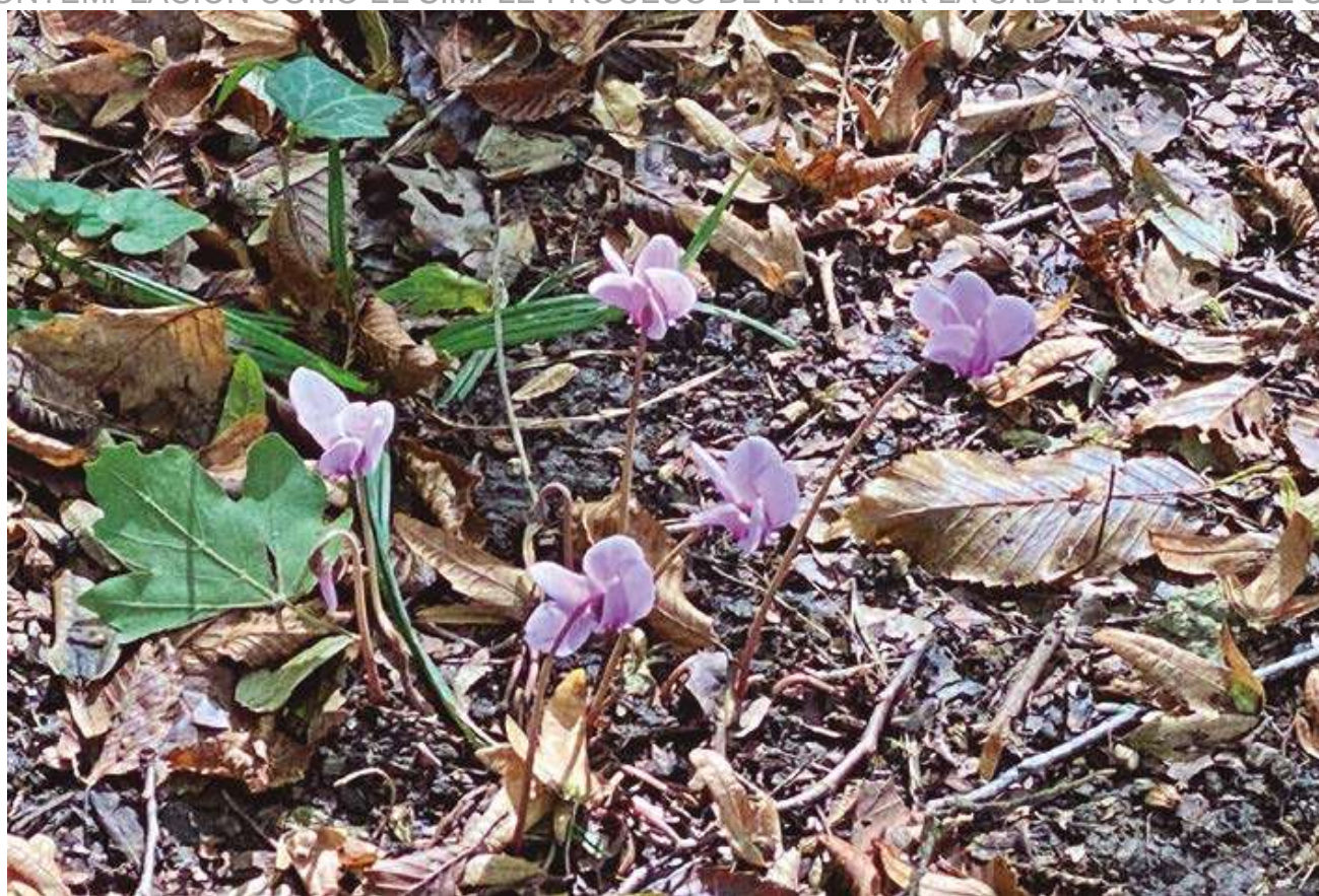
Otoño en Bonnevaux: Semana tras semana, una profusión de ciclamen cubre los bosques y senderos

RESPECTO A LA CRISIS DEL MEDIO AMBIENTE, LAURENCE FREEMAN VE A LA CONTEMPLACIÓN COMO EL SIMPLE PROCESO DE REPARAR LA CADENA ROTA DEL SER