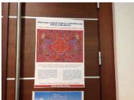
Poster de Elba de la WCCM de América Latina