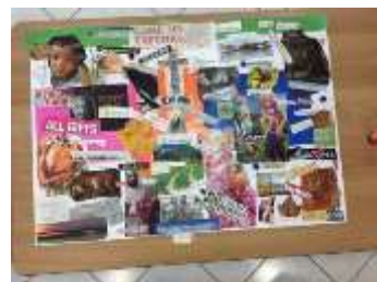
Un collage grupal de un taller

La meditación es una manera de madurar las relaciones humanas, relaciones que nos permiten regocijarnos en el ser del otro. En el silencio de nuestro propio corazón entramos en la armonía que nos revela la unicidad con el todo. John Main, La Puerta al Silencio