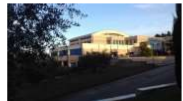
Fraterna Domus (Casa Fraterna)