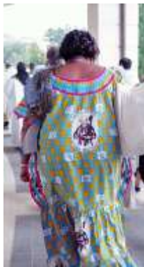
Oblata Cote Loire – Costa de Marfi