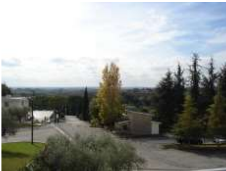
Fraterna Domus ("Casa fraterna")