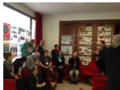
Integrantes de un taller rodeados de posters de monasterios de todo el mundo