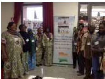
Grupo de Costa de Marfil