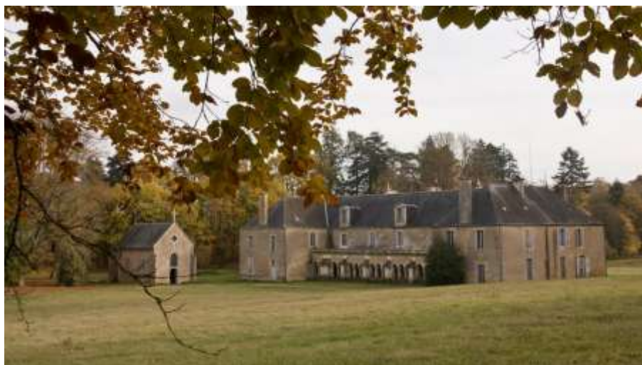
Bonnevaux: un nuevo hogar para los Oblatos