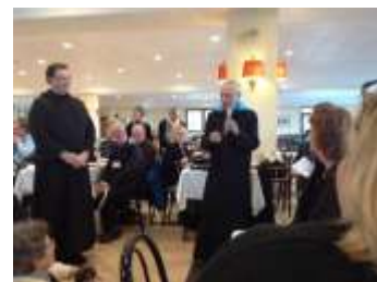
El P. Edward Linton y el Abad Primado Emérito Norker Wolf durante el almuerzo de celebración del Abad.