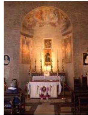
Iglesia de San Anselmo en el Aventino, Roma

Uno de los grandes momentos de la semana fue visitar la basílica de san Pedro para asistir a la audiencia papal del miércoles. Los organizadores del congreso arreglaron que tuviéramos asientos al frente con una excelente vista del Papa, el clima era perfecto, cielo azul de lado a lado y el sol cálido de noviembre nos hizo un ambiente especial. La audiencia con el Papa consiste en una pequeña enseñanza y lecturas principalmente en italiano pero también en inglés y en otros idiomas dependiendo de los grupos visitantes, y es costumbre que el Papa salude a los oblatos benedictinos y otros grupos visitantes como parte de su mensaje.