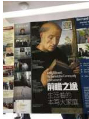
El Poster de Xiao Xiao