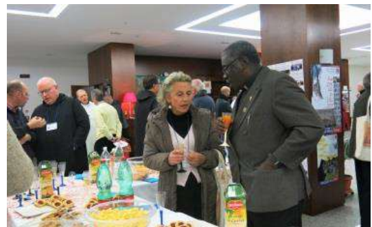
Tiempo social – Casa fraterna