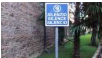
Fraterna Domus (Casa Fraterna)

Ahora debemos llevar estas visiones vibrantes y que cambian el mundo a un mundo que las necesita tanto. Existimos por una razón y solo por una razón: para convertirnos, como los grandes monásticos que tenemos ante nosotros, en la luz ardiente, llameante y abrasadora para otros que realmente queremos ser. Sus palabras inspiradoras bien valen la pena leerlas por completo; ( https://www.monasteriesoftheheart.org/monks-our.../joan-chittister—let-call-be-heard. ).