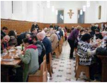
Comida en San Anselmo