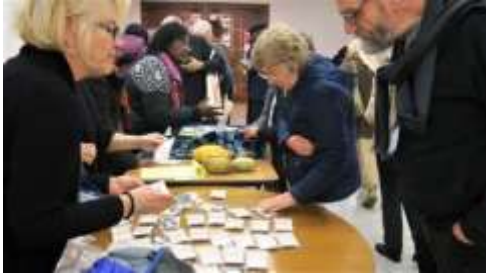
Oblatas de las Hermanas de Eire vendiendo mercancías hechas en la comunidad