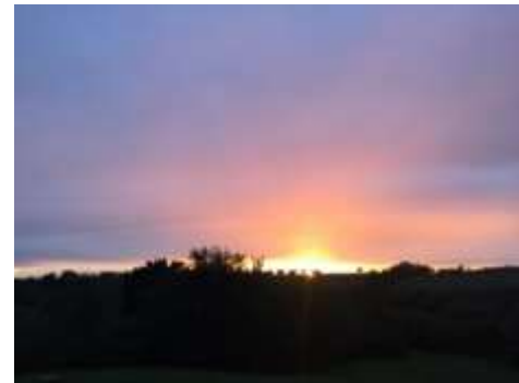
Fraterna Domus ("Casa fraterna")