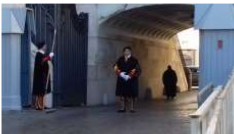
Guardia Suiza (Plaza San Pedro)