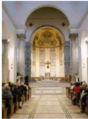
Iglesia de San Anselmo