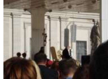
Audiencia con el Papa Francisco en la Plaza San Pedro, Roma