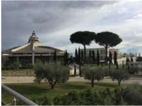
Fraterna Domus ("Casa fraterna")