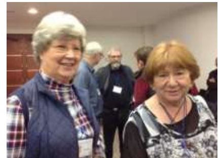
Foto: Pam, la oblata Pam Prinknash y Gloria la Coordinadora de Oblatos WCCM de Australia

El Congreso ilustró enfáticamente un cambio de la idea restringida que solo los religiosos con votos eran llamados a una vida comprometida antes que a los que expresaran un entendimiento más inclusivo del potencial y la relación de uno con el misterio que es Dios. El centro de la oblación de cada uno es el corazón y no la denominación. Uno puede también argumentar que este cambio desde un punto de vista elitista de espiritualidad es reflejado en la vida dinámica de la WCCM a través de sus programas internos y externos de divulgación y desarrollo. Además, el concepto profético de John Main de un monasterio sin paredes atestigua una alternativa viable que puede responder a las voces preocupadas de Oblatos de comunidades tradicionales que enfrentan la clausura de sus monasterios.