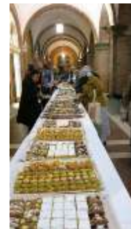
Cena en San Anselmo