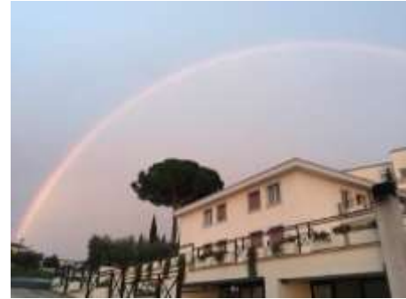
Fraterna Domus ("Casa fraterna")