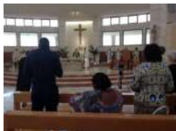
Misa en la iglesia